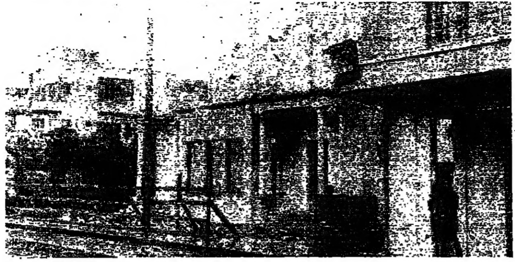
رجال الامن يراقبون امام احد المباني التي اصيبت خلال الاعتصامات